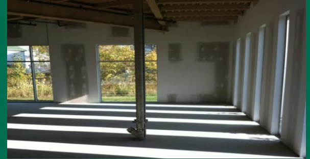
Fenêtration abondante | Large windows