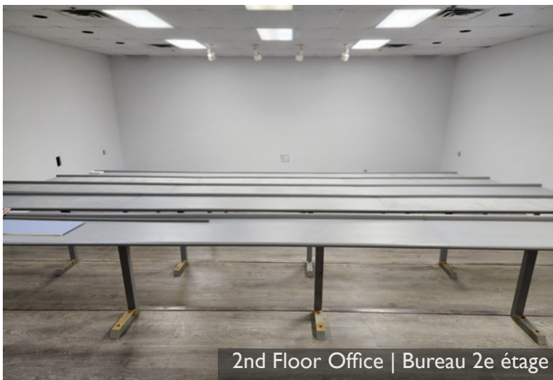
2nd Floor Office | Bureau 2e étage