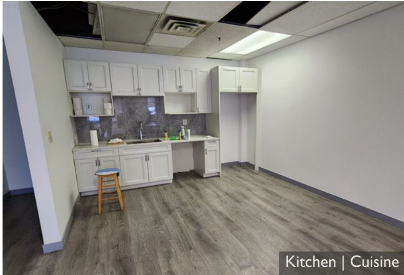
Kitchen | Cuisine