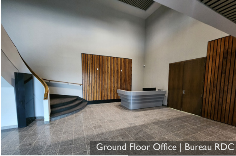
Ground Floor Office | Bureau RDC