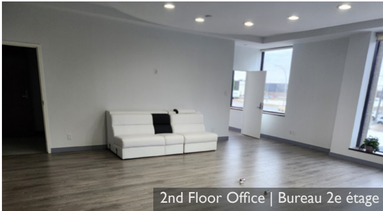
2nd Floor Office | Bureau 2e étage