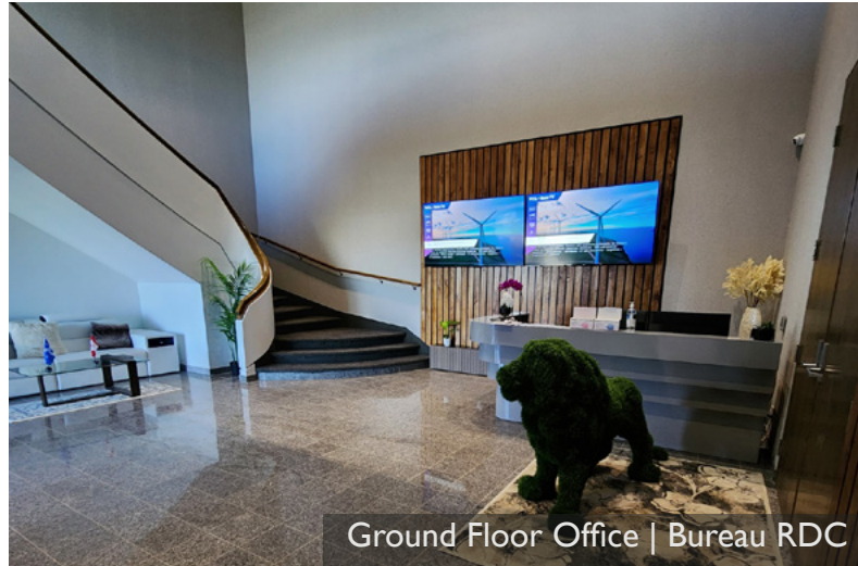
Ground Floor Office | Bureau RDC