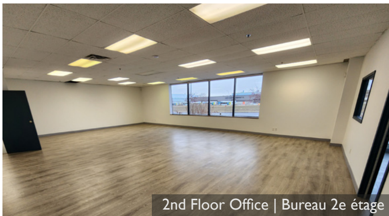
2nd Floor Office | Bureau 2e étage